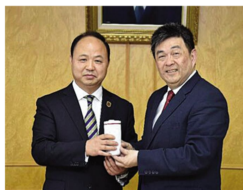
两校校长互赠纪念品。

所学科多元,完备的综合性大学。不仅可让学生选择专长研读,更可为兴趣广博的青年学子,提供跨领域的学习机会。此外,该校推广教育部,致力于提供社会人士所需要的学位与非学位的多元学习机会,连续十二年获得教育部大学评鉴中“推广服务”项目绩优学校,为台湾地区规模最大的终身学习机构。2013年我校与中国文化大学签订校际合作协议,2016年李天任校长来我校访问并参加了“情浓中秋·梦圆吉动”2016迎新晚会。两校在学生交换、教师交流及专业领域都有深入且频繁的互动,特别是由两校共同举办的两岸双校师生广告创意与设计作品展已经成功举办五届,今年扩展为两岸五校师生作品联展,规模及影响力日渐凸显。