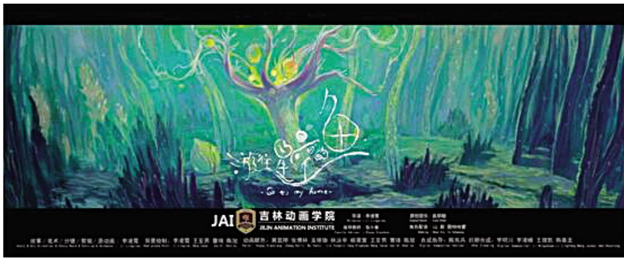
《游往星空的鱼》获2014巴西 An-ime! Arte 国际大学生动画节最佳亚洲动画片一等奖;2014 AYCC 亚洲青年动漫与数字艺术大赛最佳动画短片奖;2014 首届海峡两岸大学生创意设计大赛金奖;2015 中国大学生原创动画大赛动画设计一等奖等12个奖项。

外学术交流。学院先后邀请了史蒂夫·布朗、雨果·马特、米奥德拉格·科伦坡、米奥德拉格·科伦坡、松浦直纪、武智启一郎、布莱恩·塞缪尔·奇拉-安妮、派丽卡·德米特里·盖勒等多位国际动画大师,先后开展了创造一个IP、浅谈最新动画电影《洛克王国4》的2D内容、当代视觉特效、2015日本动漫实务谈、关于动漫制作、指环王的视效制作流程、动画剧本结构、构建动画剧本、动画长片电影对话写作、主题延展、创造世界故事、好莱坞动画电影的视觉设计潮流、如何创作一部动画短片等学术交流活动。学院多次成功举办国际动漫游戏论坛和动漫展、中日青少年动漫展等各种论坛。通过这些学术交流活动的开展,为学院的教师、学生提供了获取最新学术信息、拓展学术视野的机会,并且在交流、切磋、集思广益中形成了很多新观点和成果。(陈珍)