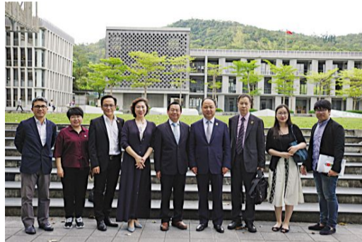
吉林动画学院与实践大学双方代表合影。

实践大学被誉为台湾教学卓越大学,是一所依山矗立、绿树环抱、建筑设计绿色环保、学习环境典雅,既有文化底蕴又富有现代气息的大学。学校于1958年建立,现有台北与高雄两校区,是设有民生、设计、管理、博雅学部(通识教育)4个学院的综合大学。2007年被美国《商业周刊》评选为全球最优60所设计院校之一,工业设计产品设计研究所于2009年获选“全球最佳设计课 Top 30”。