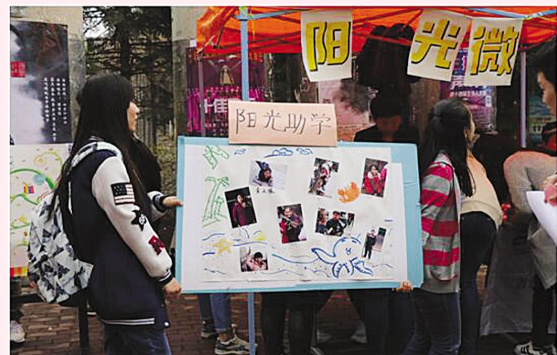
“微心愿认领”和“阳光助学”活动现场。

赠人玫瑰,手有余香。阳光支教团一直致力于帮助那些需要帮助的孩子,无论是寒暑假的支教活动,还是日常开展的特教学校活动,都身体力行地为吉动学生传递正能量,为学校的公益事业添砖加瓦。感谢所有志愿者的付出,他们是公益的先行者,也是公益事业的领导者。 (于恩文)