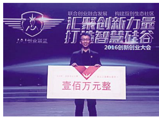
去年11月,在吉林动画学院“汇聚创新力量、打造智慧硅谷”2016 JAI 创新创业大会上,“黑豆校园”获得了学校首轮100万元的天使轮融资。