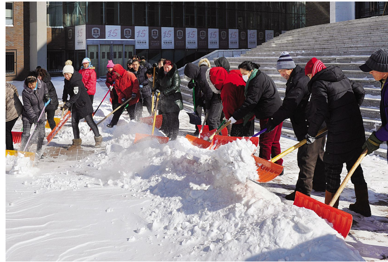
营造好环境,撸起袖子一起干。

春节期间,后勤服务中心全体保洁人员,以雪为令。从大年三十到寒假开学前,他们放弃与家人团聚,舍小家、识大体,克服重重困难坚守在岗位上,冒着严寒清理校园积雪,风雪中又见保洁工人的身影。他们用辛勤的汗水为全校教职员工营造良好的出入环境,成为吉动校园最美丽的风景。