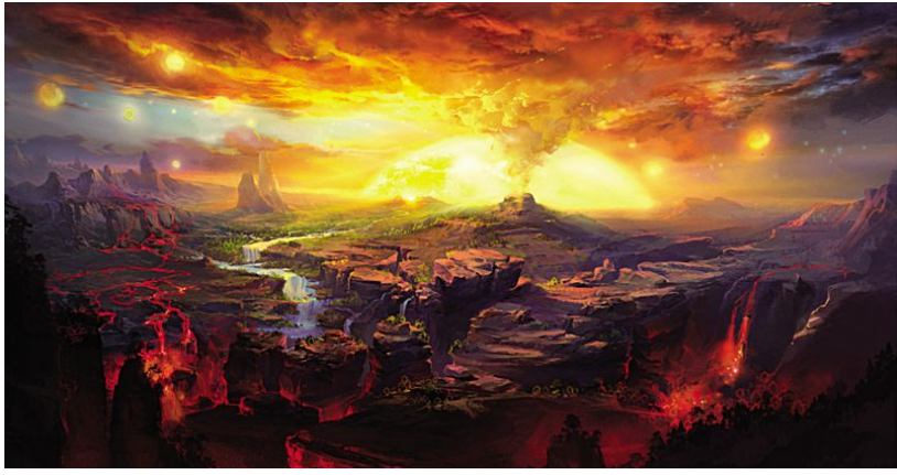
山海经之开天辟地场景

《山海经》是一部记载中国古代神话、地理、植物、动物、矿物、物产、巫术、宗教、医药、民俗、民族的著作,反映的文化现象地负海涵、包罗万象。在古代文化、科技和交通不发达的情况下,《山海经》是中国记载神话最多的一部奇书,也