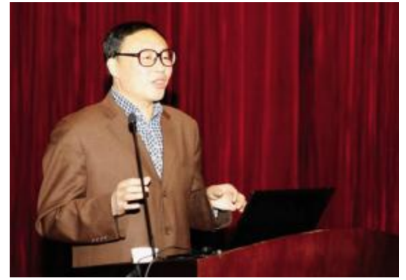
施立学教授在作讲座

本报讯(崔莉佳)12月19日下午,在我院文化艺术中心国际会议厅举行了一场内容丰富、别开生面的学术讲座。讲座由吉林动画学院院长助理、吉林动漫文化研究基地负责人王首民主持,主讲人是对东北地域和民俗文化有着深入研究和独到见解的施立学教授。