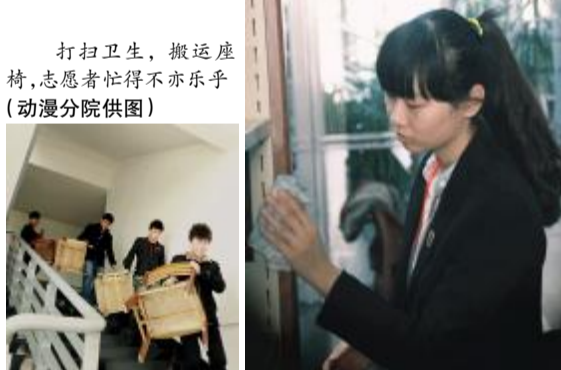
打扫卫生,搬运桌椅,志愿者们忙得不亦乐乎

志愿者的无私奉献让校园变得更加多彩,动漫分院12.5国际志愿者活动日志愿服务活动,提高了同学们对公益事业的认识,发挥了当代大学生促进社会和谐的作用,体现了当代大学生的活力与风采。通过此次志愿活动,不仅使同学们得到了锻炼,同时也增强了责任意识,让同学们学会关爱他人、奉献社会,充分展现当代大学生的精神风貌。