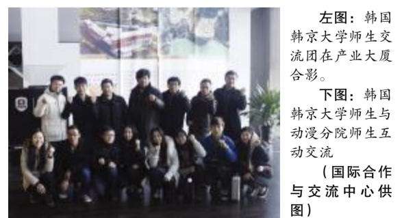
左图:韩国韩京大学师生交流团在产业大厦合影。

本次韩国韩京大学师生交流团访问我院,是双方合作的重要契机。今后还将通过多样的形式开展更加深入的交流,取长补短,互惠互利,谋求更大的发展。