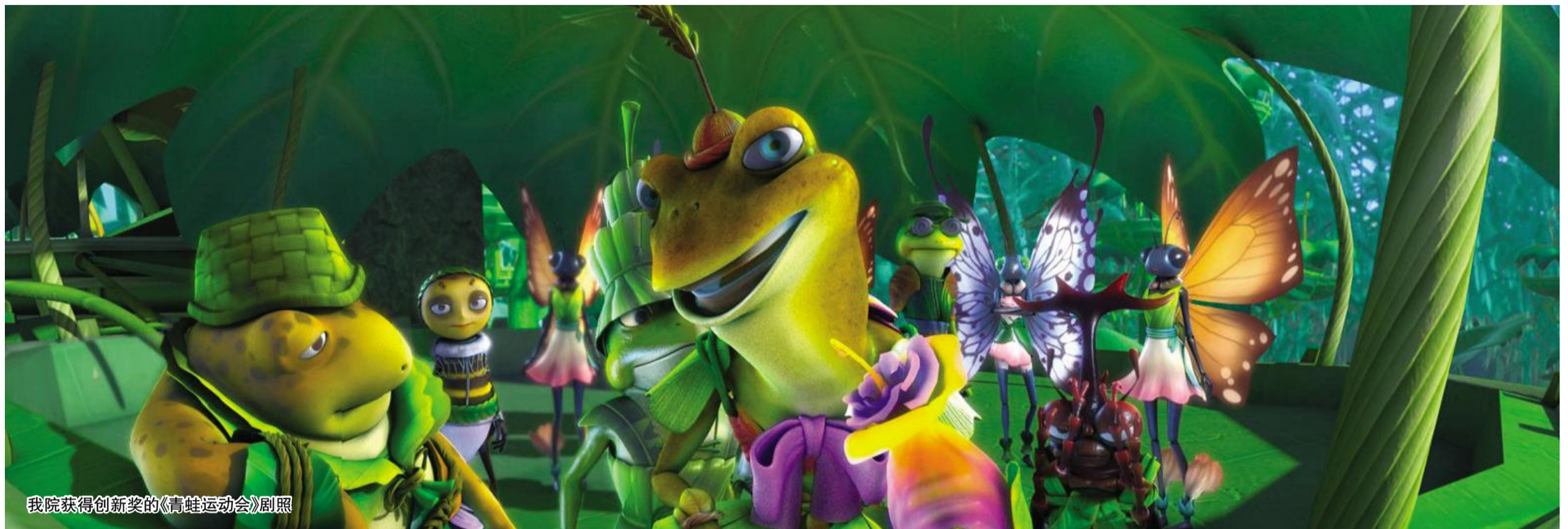
我院获得创新奖的《青蛙运动会》剧照