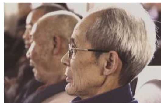
老人们聚精会神地观看演出