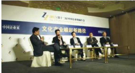
“文化产业崛起新路径”高峰论坛现场