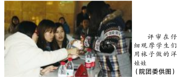
评审在仔细观摩学生们用袜子做的洋娃娃

本报讯(院团委李冲)为倡导低碳生活进校园,增强大学生的环保意识,树立环保观念,近日,吉林动画学院阳光社勤工助学组织举行“低碳环保、废物利用”优秀作品展示活动。同学们利用生活中的废旧光盘、塑料泡沫、旧纸张等,经过精心设计制成各种精美作品,让废弃物焕发新的生命力。