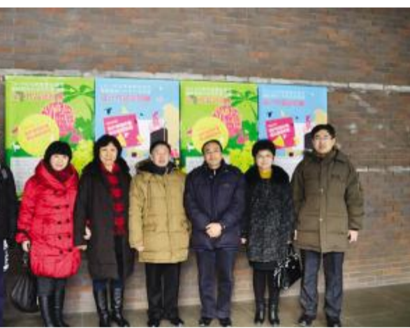
吉林省及长春市科协领导与学院领导、设计分院领导合影

吉林省、长春市科学技术协会领导参观海峡两岸大学生科普创意设计作品巡回展期间,设计