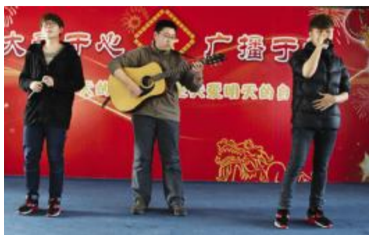
为老人表演精彩的文艺节目