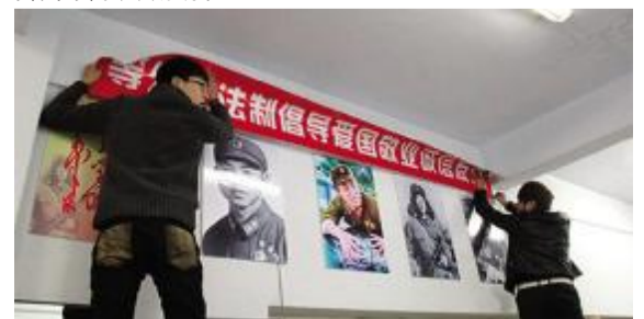
精心设计“美丽小屋”

通过这次的展示活动,学生会成员都有了一次相互合作的机会,学会了团结友爱、团队合作。