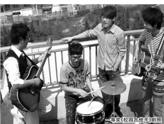
一等奖《校园吉他手》剧照