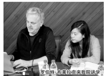
罗伯特·布莱拉克来我院讲学

本报讯 6月3日，视觉特效制片人、总监罗伯特·布莱拉克来我院作了题为《<阿凡达>解密好莱坞》的讲学。大师的精彩讲学，精湛的学术造诣深深地感染激励着莘莘学子，同学们感到享受了一场丰盛学术大餐，受益匪浅。