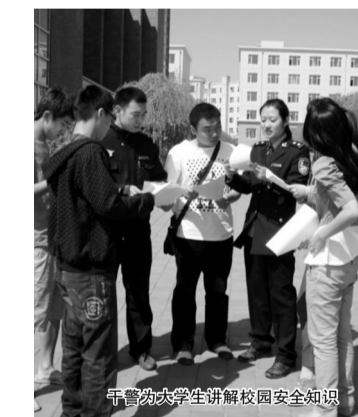
干警为大学生讲解校园安全知识

本报讯 我院近期积极开展了系列消防安全知识培训及宣传活动。受到学院教师与学生的重视，掌握了必要的安全知识和防范技能等。