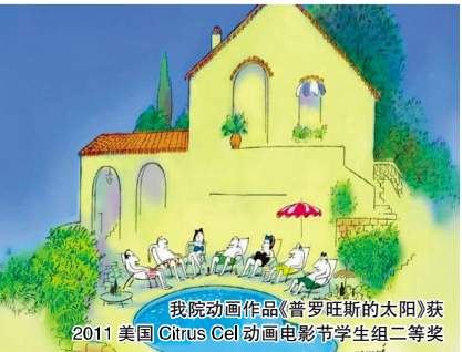
我院动画作品《普罗旺斯的太阳》获2011美国Citrus Cel动画电影节学生组二等奖

4月27日,吉林省高校重点实验室、工程研究中心验收和遴选工作专家组来我院进行“现代动画技术工程研究中心”验收,并对“游戏与互动媒体技术工程研究中心”进行遴选。6月15日,喜获我院通过验收的消息,“游戏与互动媒体技术工程研究中心”也被批准为吉林省高校工程研究中心立项培育单位。学院将结合专家组提出的建议,加强工程研究中心的运行管理和开放交流,继续推进工程研究中心建设,加强应用研究,为地方经济社会发展服务,并争取早日晋升为教育部工程研究中心。